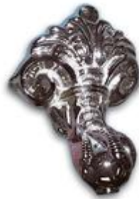
Pata modelo acanto